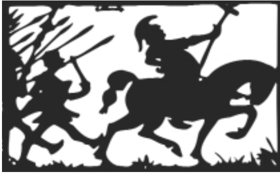
Motiv einer Banknote von Detmolder Notgeld 1920 mit der Aufschrift: „Als die Römer frech geworden zogen sie nach Deutschlands Norden vorne mit Trompetenschall ritt der General Feldmarschall Herr Quintilius Varus“

Regime stärker auf andere nationale „Helden“ und „Märtyrer“, wie beispielsweise Horst Wessel oder Albert Leo Schlageter , die eine engere Verbindung zur NS-Bewegung aufwiesen. Zudem dürften diplomatische Erwägungen eine Rolle gespielt haben, hätte doch eine allzu offensichtliche Verehrung des „antirömischen“ Befreiungshelden Arminius zur Verärgerung des faschistischen Bündnispartners Italien beitragen können.